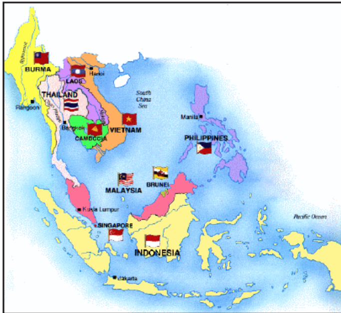
Les dix membres de l'ANASE.

de la personne comme une responsabilité morale. Puisque les normes internationales de droits de la personne ont évolué afin de reconnaître que la souveraineté d'un État n'éclipse pas les violations massives de ces droits, le Canada a entamé des procès et a condamné publiquement de plus en plus leurs violations. La position de Brian Mulroney envers l'Apartheid en Afrique du Sud est souvent citée comme un des premiers cas où le Canada s'est écarté d'une position réaliste plus traditionnelle envers les droits de la personne. Pendant les années 1980 et 1990, les droits de la personne sont devenus de plus en plus importants pour l'électorat canadien et ont été promus à l'étranger comme une percée internationale des valeurs canadiennes à l'étranger. Le gouvernement actuel a aussi suivi cette voie en formulant les droits de la personne en termes de valeurs canadiennes, bien que cela n'ait pas eu d'effet particulièrement fructueux sur ses principales relations en Asie. Cette stratégie de promouvoir les valeurs canadiennes à l'étranger a été critiquée comme étant moralisatrice, de l'impérialisme de scout et de la diplomatie d'église. 21