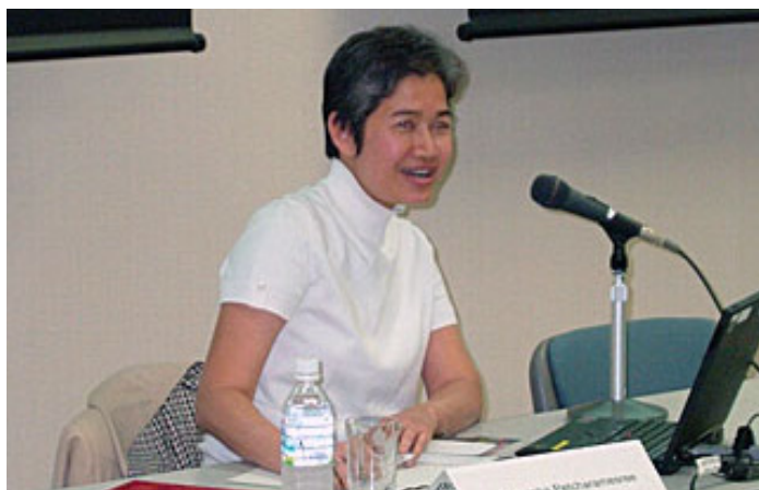
Sriprapha Petcharamesree, la représentante de la Thaïlande sur la Commission intergouvernementale de l'ANASE sur les droits de la personne.

La région de l'ANASE est une région diversifiée peuplée de 580 millions de personnes et dont le PIB totalise presque 1,6 billion de $. Ses membres se consacrent au développement d'une communauté de l'ANASE basée sur des intérêts communs, tel que décrit dans la charte de l'ANASE 2008. En tant que groupe, l'ANASE veille loyalement à des valeurs de non-intervention