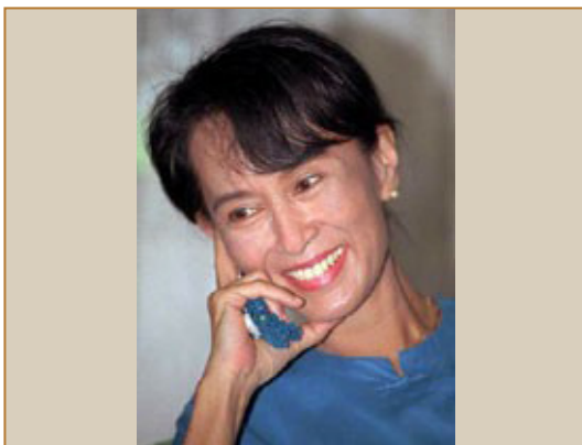
Aung San Suu Kyi – le défi pour l'AICHR.

Il y a eu beaucoup de débats pour déterminer si l'AICHR aurait les dents assez solides pour stimuler un progrès réel du respect des droits de la personne dans la région. À cause de préoccupations de transparence, d'indépendance et d'efficacité, certains groupes dans la société civile ont douté de l'utilité de l'AICHR 10 et l'ont critiquée depuis sa création. À la première réunion de l'AICHR à Jakarta, les représentants ont décidé que cette commission n'entendrait pas les plaintes individuelles de droits de la personne, mais se concentrerait plutôt sur des plaintes thématiques plus générales. De plus, les décisions prises à cette commission seraient basées sur un consensus et les termes de référence comporteraient une articulation prudente