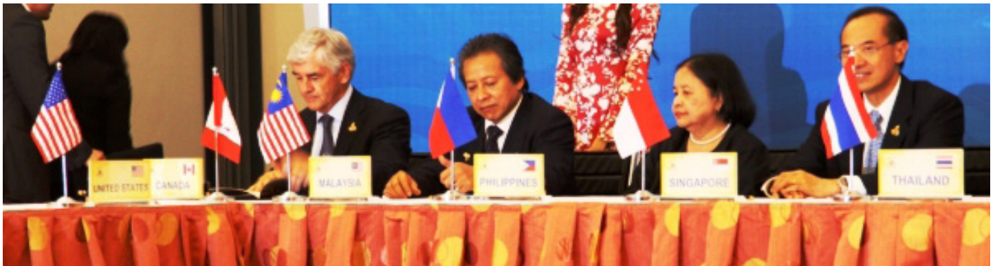
Le ministre canadien des Affaires étrangères, Lawrence Cannon qui a participé à la Conférence postministérielle de l'ANASE et au Forum régional de l'ANASE à Hanoi les 22 et 23 juillet 2010.

L'AICHR devra aussi combler un vide dans l'infrastructure régionale des droits de la personne. Tel que mentionné ci-dessus, l'Asie manquait d'un mécanisme intergouvernemental pour les droits de la personne. Des instruments fonctionnels sur les droits de la personne existent en Europe, en Amérique et en Afrique et sont les éléments critiques des systèmes internationaux des droits de la personne. Les systèmes régionaux soutiennent le travail d'organisations internationales mandatées pour protéger les droits de la personne en contribuant à localiser les normes de droits de la personne et les pratiques pour refléter les préoccupations au sujet des droits de la personne dans la région. 16 Si les instruments nationaux pour protéger et promouvoir les droits de la personne échouent, les mécanismes régionaux pourraient porter secours aux victimes. De plus, les gouvernements nationaux pourraient préférer réagir à des demandes régionales, plutôt qu'à des demandes internationales de changement.