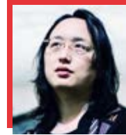
唐鳳 AUDREY TANG 行政院政務委員

伍部長在她20年的公共服務生涯中，一直是位具有堅定志向的社會領袖，專注於創造就業機會、扶植企業家精神並培育小型企業創新與發展的能力。